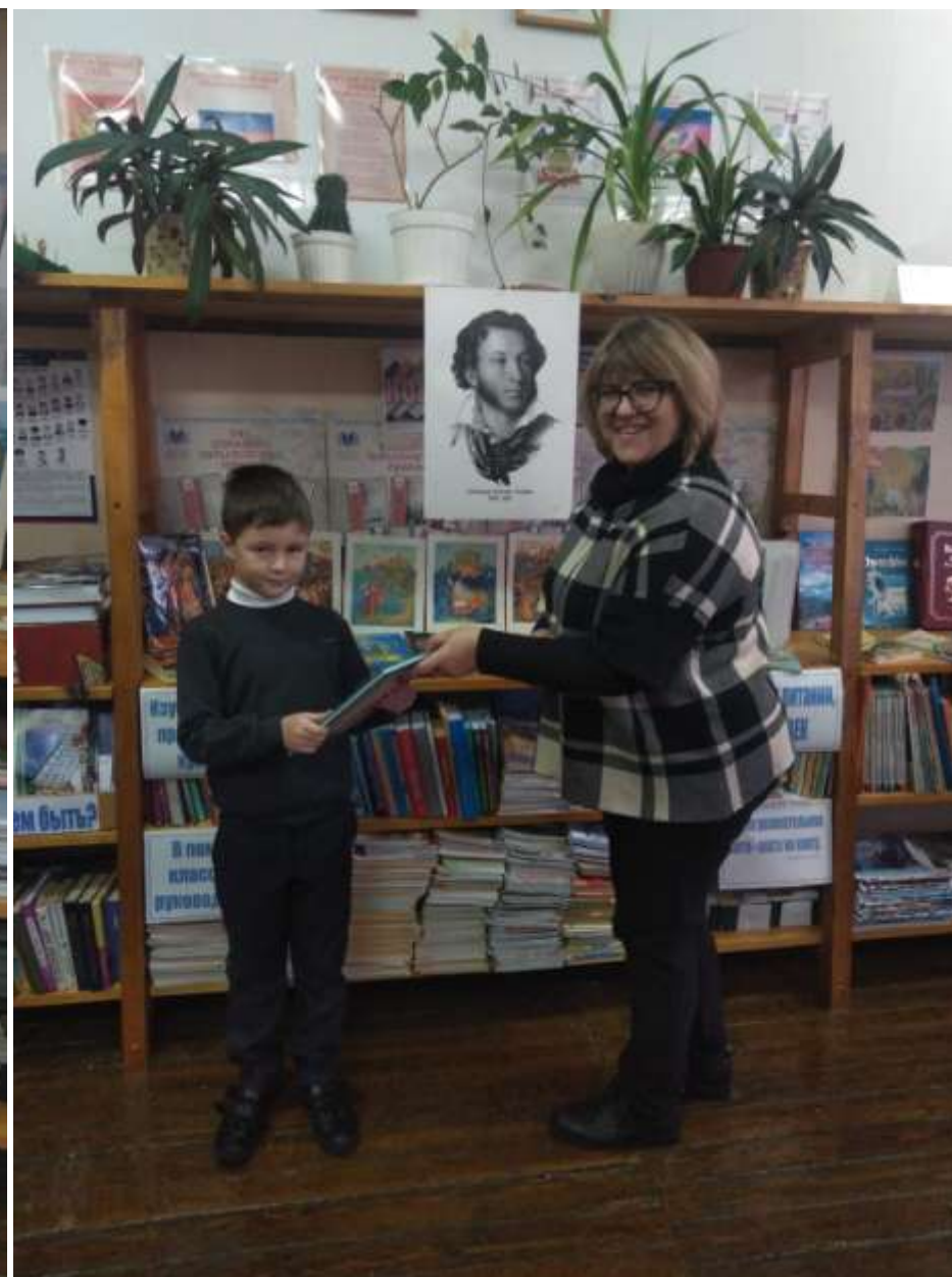
Вторая жизнь книг